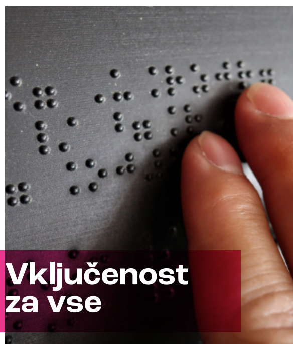
Vključenost za vse

Področje akcije: ranljive skupine Vrsta akcije: urejanje javnih prostorov