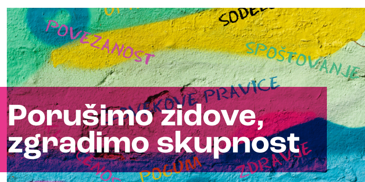
Porušimo zidove, zgradimo skupnost

Ste ugotovili, da park, v katerem svoj prosti čas preživljajo otroci, potrebuje spremembo na bolje? Povežite se in poskrbite, da bodo klopci lepših barv in dostopne vsem otrokom v vašem kraju. Predvsem pa ne pozabite najprej vprašati otrok kaj si zares želijo oz. potrebujejo. Na akcijo povabite vse občane.