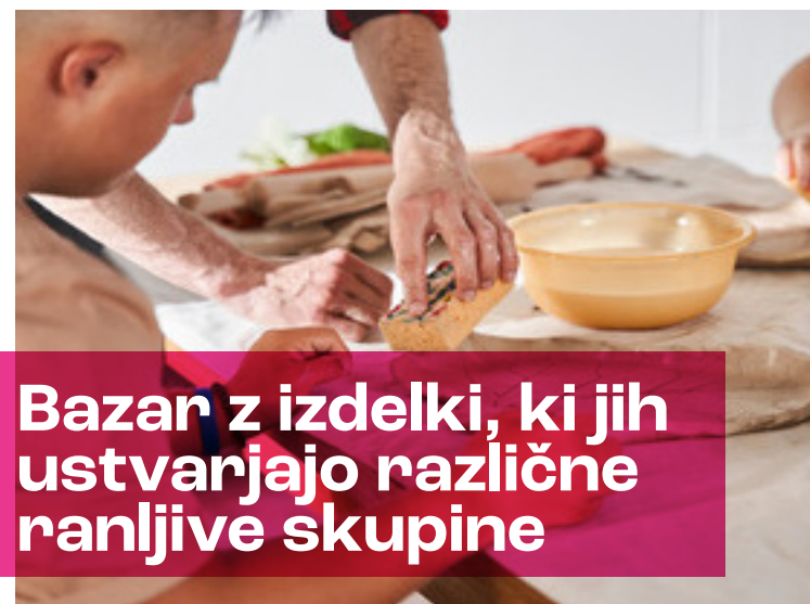
Bazar z izdelki, ki jih ustvarjajo različne ranljive skupine

Skupnostna knjižnica je preprost način, da naredite nekaj lepega za svoje občane. Preprosto postavite knjižne omare na javne prostore v vaši občini in prosite udeležence, da v knjižnico prinesejo knjigo ali dve. Kmalu boste imeli pravi skupnostni projekt, ki bo temeljil na izmenjavi »knjiga za knjigo« in prispeval k bralni kulturi.