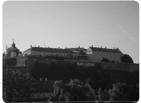
Pri organizaciji Festivala Exit je letos sodelovalo 600 prostovoljcev