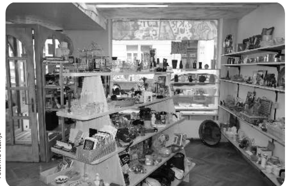
Prostovoljci so pomagali pri urejanju Mladinskega hotela

Vse preveč stvari, ki so še popolnoma uporabne, se v teh časih nepremišljeno zavrže in tako obremenjuje okolje. Stvar, ki je za nekoga odvečna, pa lahko pride nekemu drugemu še zelo prav. Tako smo začeli zbirati rabljene stvari, ki nam jih podarijo ljudje. Očistimo jih, po potrebi obnovimo, ocenimo in postavimo na police v posredovalnici, kjer počakajo na novega lastnika. Posredovalnica omogoča prostor za usposabljanje, razvijanje delovnih spretnosti, pridobivanje in izmenjavo izkušenj ter tudi zaposlitev brezdomnim in drugim socialno izključenim ljudem, obenem pa je zaradi nizkih cen dostopna ljudem v slabšem materialnem položaju. Posredovalnica predstavlja tudi prostor za druženje in spoznavanje ljudi z različnim družbenim ozadjem. Če vas zanima prostovoljsko delo, imate doma preveč stvari, potrebujete kaj novega oziroma starega, ali pa ste samo radovedni, vas vabimo, da nas obiščete na Poljanski 14 v Ljubljani.