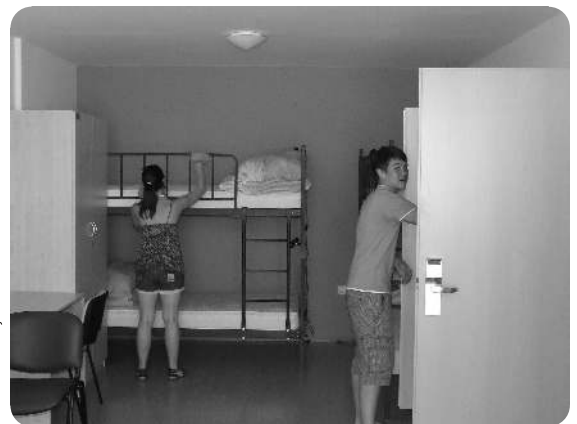
Prostovoljci so pomagali pri urejanju Mladinskega hotela

Prostovoljci Mladinskega centra Velenje tako svojo aktivnost izkazujejo skozi vse leto, tudi v poletnih dneh, in so vedno pripravljeni pomagati, tako lokalni skupnosti kot tudi bližnjemu, kar pa je tudi največja vrednota prostovoljstva.